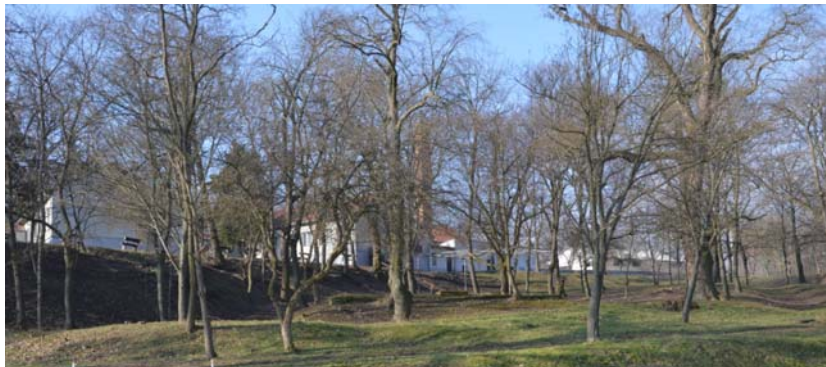
Az iskola lépcsőzetes kialakítású parkja, egykor a Szirmay család kastélyának parkja

Emellett a tervek között szerepel a rehabilitálandó településrészen fekvő, a néhai Szirmay kastély parkjának területén működő iskolakertben is egy kb. 30 fő elszállásolására alkalmas több kis épületből (faház) álló tábor felépítése , mely akár külön családok, turisták, akár az erdei iskola programjait szolgálhatja.