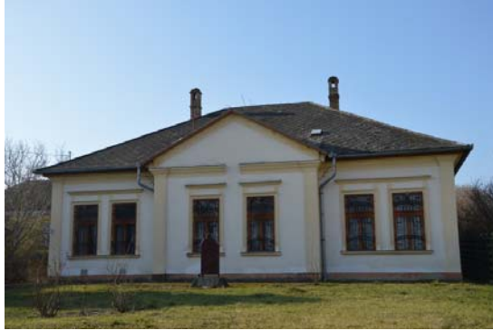
Papp Károly Kúria

az erősen rehabilitációra szoruló településrészen található, a templom, a temető, a TáborSág, az általános iskola, a kialakítandó parasztház-szállások szomszédságában. A Kulturális Szolgáltató Ház és a Papp Károly kúria kertjeit összenyitva, közösségi célokat szolgáló parkot kialakítva regionális szinten páratlan kultúrudvar születne, mely lehetőséget adna a virágkorát élő, művészeti célú programok megvalósítására is, akár művészeti fesztivál megrendezésére.