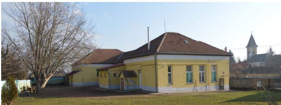
Mai „kiskola” épülete - a leendő kulturális szolgáltató ház épülete a kúria szomszédságában